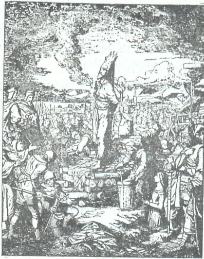
წიანჭუსი კოცონზე (1369—1415) .. ჩხელთა დიდებული მამულიშვილი, მქადაგებელი და რეფორმატორი. ციცილის ხუთასი წელიწადი შესრულდა, რაც ცეცხლზე დასწევს. (იხ. წინა წერილი „კატობრიობის უკვდავი შვილი“).