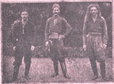
აქარელი ქართველი მამუადიანები შუა აქარაში, ბორჩხასა და მარადილს შუა მდებარე სოფ. ინკორვეთის შქხოვრებნი. ამ ადგილებს ედემის მსგავსი ბუნება აქვს. მქხოვრებნი რაინდი და ყოჩალი ხალხია.

ქართალი, 5 ივლისი | მიიღება ხელმოწერა 1915 წ., თებერლი და სხოვნება - ზე | № 27 - 1915