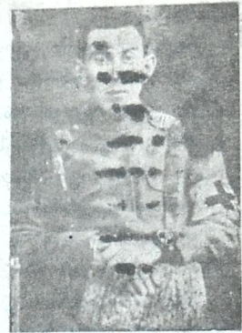
ჯ. - კ. ივ. ნახუცი შვილი ნაშემელი, სარიყამიშთან ბრძოლის დროს, 21 დეკ. მოკლული.