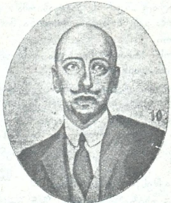
გაბრიელ დანუნციო (რაპანიეტა)

იტალიის გამოჩენილი მგოსან-დრამატურგი, ავტორი „იორიოს ასული“ს, „ჯიოკონდა“-სი და მრ. სხ., თავისი ნებით იტალიის მომქმედ ჯარში ჩაეწერა.