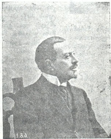
თავ. დიმატრი ერასტიხძე ჩოლოყაშვილი თბილისის გუბერნიის თავ.-აზნაურთა წინამძღოლის თანამდებობაზე არჩეული.