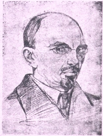
ნახატი ალ. ტომკეოვისსა.

რესპუბლიკის სახალხო არტისტი სამუსიკო-საზოგადო მოღვაწეობის 30 წლის შესრულებისათვის აპრილის 12 გადახდილ იუბილეს ვიზო.