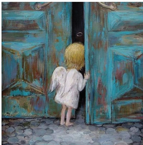
პატარა ანგელოზი, მხატვარი ნინო ჭაკვეტაძე

ვიცი, დრო ცოტა გაქვს, სხვაგან გელიან. აშაღე გუნდი ყორნებივით შავი ეჭვების. ჩაშლილ ფიქალზე, ვით არშია, დატოვე შენი თეთრი ფრთების და ციციქნა ტერფების ანაბეჭდები.