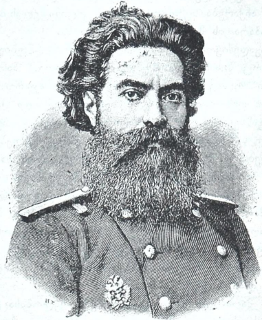
† ი. რ. თარხნიშვილი.

განსვენებული კარგათ იყო ცნობილი მთელს ევროპაში, როგორც გამოჩენილი ფიზიოლოგი. რუსეთის მეცნიერთა შორის მას პირველი რიგის ადგილი ეჭირა. მას თვალსაჩინო წვლილი შეჰქონდა მეცნიერების წინსვლა-განვითარებაში, მისი სიკვდილი ერთბაშად დიდი დანაკლისია მთელი რუსეთისათვის, რომელიც ასე ღარიბია სამეცნიერო ძალებით.