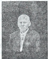
პროფესორი ოდესის უნივერსიტეტის.

გარეთ და ბონის უნივერსიტეტში ისმენდა ლექციებს. 1874 წ. კვლავ დაბრუნდა ოდესაში და აქ სახელოვანთა დოცენა დისერტაცია, რისთვისაც მიიღო ქიმიის მაგისტრობის ხარისხი. 1877 წელს მიიღო კიდევ მაღალი სამეცნიერო ხარისხი, დოქტორობა. 1878 წელს გაბზავნეს სახლვარ გარეთ 2 წლით და პარიკის უნივერსიტეტში ისმენდა ცნობილ მეცნიერების ლექციებს და მუშაობდა იმავე უნივერსიტეტის ლაბორატორიაში. სახლვარ გარეთიდან დაბრუნების შემდეგ განაგრძობდა ლექციების კითხვას ოდესის უნივერსიტეტში, სადაც მალე დანიშნულ იქნა ფიზიკა-მატემატიკურ ფაკულტეტის დეკანათ. 1906 წელს არჩეულ იქმნა რექტორის თანამდებობის აღმასრულებლათ.