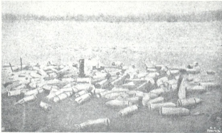
ბრძოლის ველი, გერმანიის არტილერიის ოტების შემდეგ.