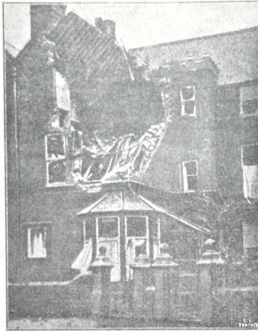
გერმანელთა ყუმბარებისაგან დანგრეული სახლი გარტლბულში (ინგლისი).