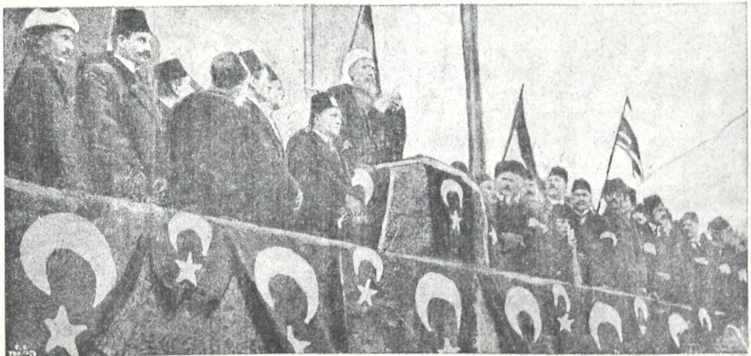
ოსმალეთის სამღვდლოების უფროსი, სტამბოლში მეჩეთის აიენიდგან კითხულობს საღმრთო ორსადმი მოწოდებას.

სომხური პრესა, თქმა არ უნდა, უარს ვერ მეტყუვის თავისუფალ ვალდებულობაზე. პირიქით, „ზაკავკ. სლოვო“-ს სახით ხშირად ქათინაურებს შემასმენდნენ, რომ სომეხთა საკითხი გამეჩვივა. მათ ისე მოეჩვენათ, ვითომც კიდევ გადავჭერი საკითხი და ისიც არა მათ სასარგებლოდ. „ჰორიზონი“ ამტკიცებს, რომ მე „უვიცთა რიცხვს ვეკუთვნი“. „არევი“ უფრო თავაზიანია, მისი აზრით, მე საკმაო ცნობები არ მომეზოვებოდა და არც საშუალება მქონდა სომხურ მასალებს დაეყრდნობოდი. ასეა თუ ისე, სომხური პრესა იმას კი არა სცდილობს უარპყოს ჩემი დებულებანი, არამედ დამანახვოს მე და ჩემს მკითხველებს, თუ ნამდვილად როგორია სომეხთა შეხედულება მათ ეროვეულ კითხვების გასარკვევად. უეჭველია, სწორედ ამას უნდა მიეწეროს, როდესაც მათ უმთავრეს საიერიზო ბაზად გაიხადეს ჩემი წერილის შესავლის ერთი