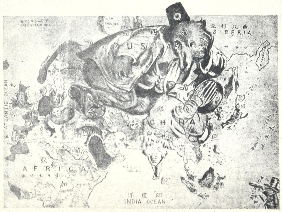
დღევანდელი სახელმწიფონი მხეცთა და ცხოველთა სახით.