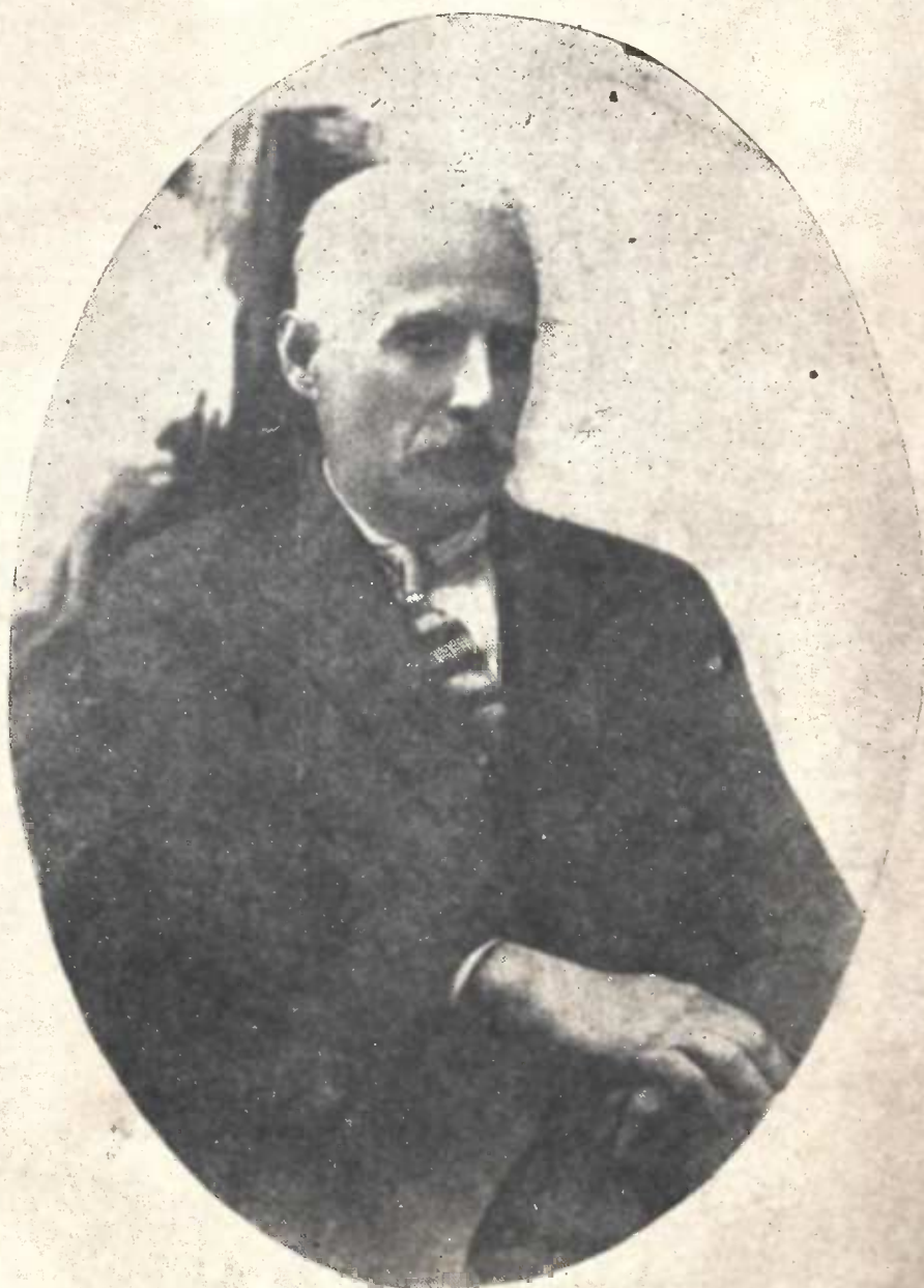
მ. ლასხივილი (1866—1933)