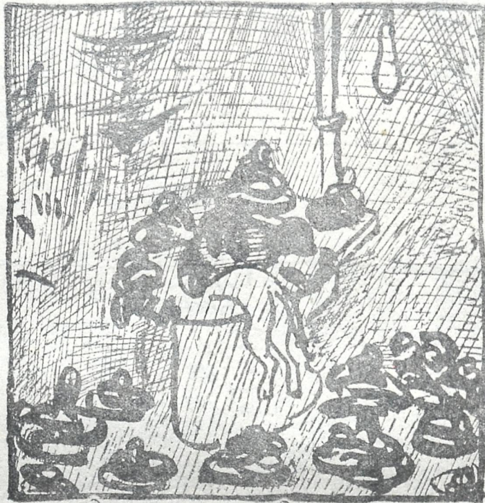
დღეღვაყიამ აშკარად დაინახა საბჭოთა კულტურის ნაყოფიერება.

„ბათუმელი ქალები მხოლოდ ჩვენ „შტატსკებს“ დაგყვებოდა და აფიცრებს, კომისრებს, მილიციონერებს ყურადღებას არ აქცევენ.