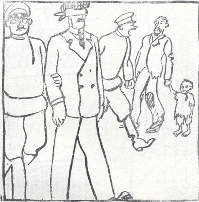
დღეღვატია ძლიერ გააკვირვა მოსკოვის ქუჩების წესრიგმა.