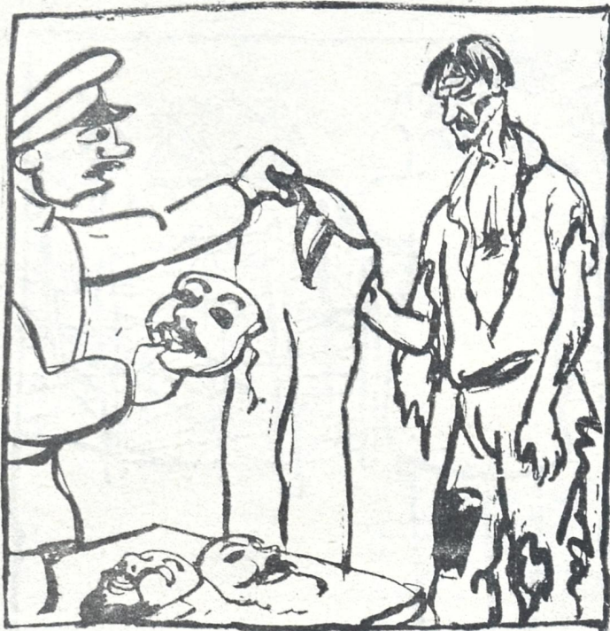
საბჭოთა მთავრობამ ყოველგვარი დახმარება აღმოუჩინა მუშებს, როგორც ტანსაცმელით, აგრეთვე ნიღბებით და პარკებით,

—კიობს ბაძავს პოლონეთი, მისდევს სასაენარკოშეთი, ფიქრობს: „შეტუიო ერთი, ვაწყველინო პანებს ღმერთი გავაწითლო პოლონეთი, ხელს მოგვაწვდის გერმანეთი, და როდესაც ერთმანეთი—