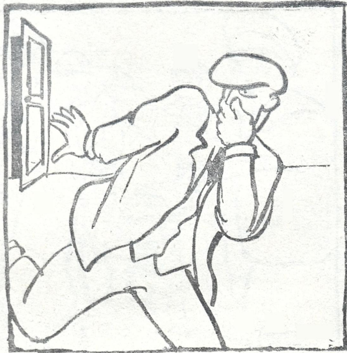
უკანასკნელმა მთაბეჭდილებამ ყოველსავე მოლოდინს გადააჭარბა.