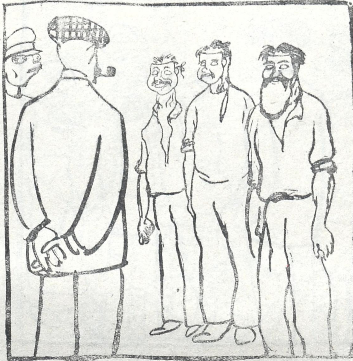
რით მათ (მუშებს) პირნათლად და პირ მსუქნად შესძლებოდათ წარდგომა დასავლეთის პრო-ლეტარიატის წინაშე.

ქემალ „დაგიმეგობრდება“, ჩვენც იმას ხელს გაუწვდითო, ევროპას სულს ამოვწვდითო, იმ ევროპას, რომელს შენტვის მანდატიც კი სჩანს, შეშურსა, და შენებრ ერს უბედურსა, აღარც კი უგდებენ ყურსა, ნუ თუ სიწითლე არ გსურსა, გშიათ?—გაქმევთ ჩვენ თეთრ პურსა, ოღონდ თქვენ სიკეთე ჰქენით, ოღონდ ჩვენი შეიქენით, და ვაგონი რაჟე ძღვენიო მოსკოვს წაგასოვნარკოთო, აბა, ტყვილად რად ვიომოთ, ჩიჩერინს რატომ სწვით ნოტებს, აბა, სთქვით ვინ იბოროტებს, ვინ გმწვევათ ავი ზრახვით, (ფლავი კი სჯობს ერბო—ხახვით) როს დავსტკებთ შენი ნახვით, მენატრებთ გფიცავთ, აჰ, ვით?!