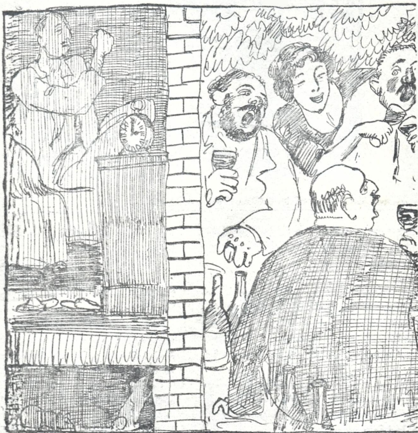
მისამხახურე (რომელიც თვეში ძველი კურსით სამ მანის იღებს, რომელიც ისე სულელია, რომ ქრთამს არ იღებს, რომელიც სამსაგურში ექვს საათზე მიდის და რომელიც ყოველ საღამოს მშვიერი წვება — ღმერთო ჩემო! უკვე ნაშუალამევის საში საათია! სად არის ერთი ზოლორა რომ ასეთი შთაქრობა ქკუაზე მოიყვანოს... (მუშტებს იღებს საბრალო, მაგრამ რა გამოვა თავის ოთახში მუტების მოღერით!)