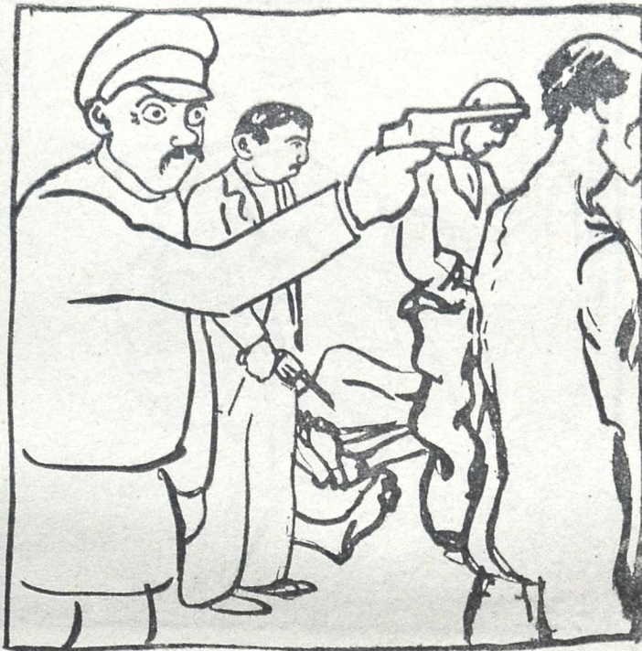
თუშუცა მას ყველაფერი იმ სახით არ დაუნახავს, როგორც ნამდვილად ხდება.

რომ გაეკუსწორდა და ვკითხე, სულ სხვა ინვალიდები აღმოჩნდნენ: ესენიც ჩემსავით მატარებლიდან ჩამონათრევი ხალხი ყოფილიყო და ამათაც ჩემსავით ქვეითად წასვლა გადაეწყვიტათ.