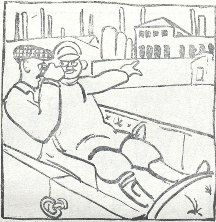
რათა წვრიმაღლებზედ დელეგაციას, დრო არ დაეკარგათ, ფაბრიკები და ქარხნები დათვალიერებულ იქნა გაქანებული ავტომობილიდან.

რვილისა, დიდის ბრძოლისა და კიდილის შემდეგ, ყოვლად დაუნდობლად ჩამომართიეს მატარებლიდან და კინალამ კისერიც მომატებინეს.