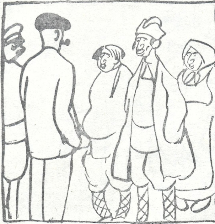
დედგაგაცის წარუღა აგრეთვე რუსეთის ძირითადი გლეხობა.

რა ვიცი, ვის რა უყილა... (სჯობს საღმე ჩამოვეცილო.) აბა, რაქნა ას პროცენტით?! გთხოვ, ფულებო, აღმოცენდით საღმე მინდრად რომ მოკთიბოთ, მოგაგროვოთ, ჩავიჯიბოთ, იქნებ მაშინ რამეს გავხდემ, ცოტას გავძლემ, თლად არ გავხდემ, თორემ ჩემმა პაიოკმა