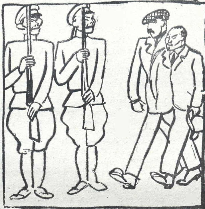
დელეგაცია განცვიფრებაში მოიყვანა ჩინელების საბჭოთა ჯარის შეხედულობამ.

შეედავა მეორე—გუშინ თავმჯდომარეს განუცხადებია: