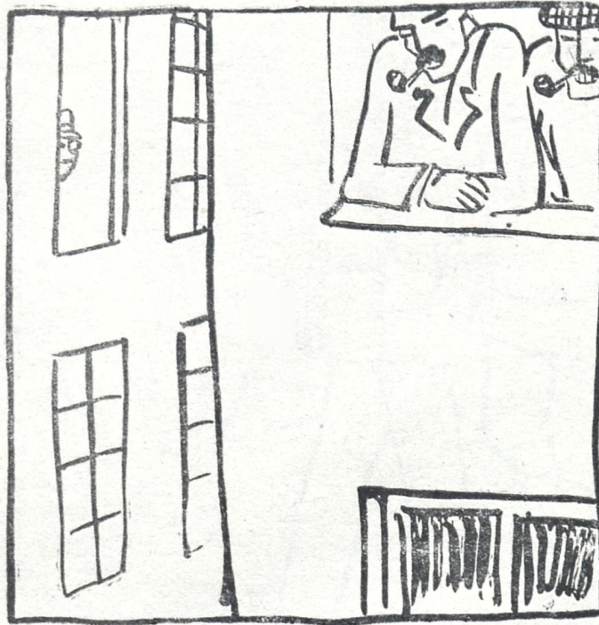
სოენარკოშა დელეგაციას ნება დართო თავისუფლად დათვალიერება მთელი რუსეთისა ფანჯრიდან.

ამისთანავე სამსჯავრომ დაადგინა ზემოაღნიშნული დადგენილება უცვლელად დაიბეჭდოს ჟურნალ „ეშმაკის მათრახში“, რასაც ჩვენ დიდის სიამოვნებით ვასრულებთ.