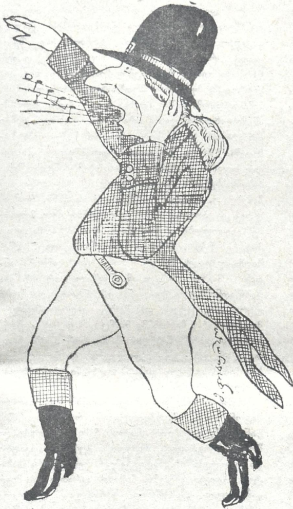
მიშელ ღარიალ — ნანობაშვილი — ვერტერი