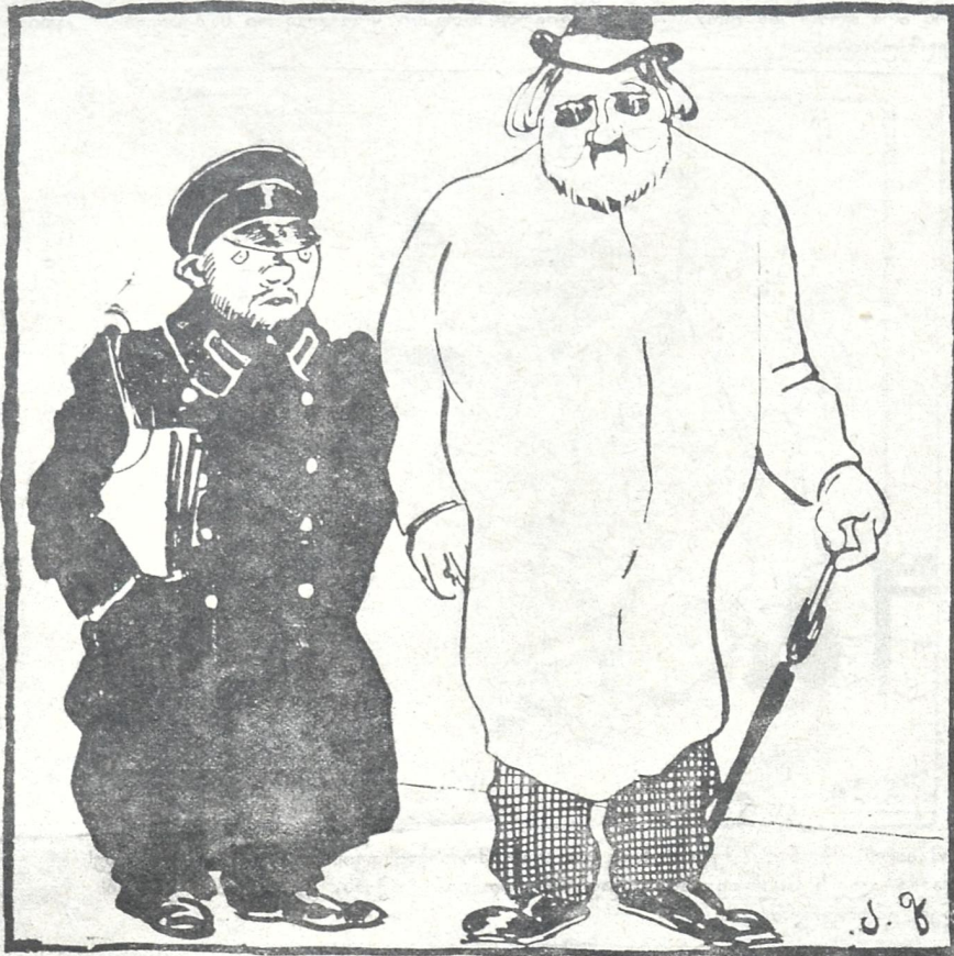
გუშინდელი კონტრეკოლუციონერები. ამ ტომის ხალხი ამ ჟამად აღარ არის ლესეთში. უმრავლესობა დახვრიტეს, ხოლო დანარჩენები საქართველოში შემოიხიზნენ