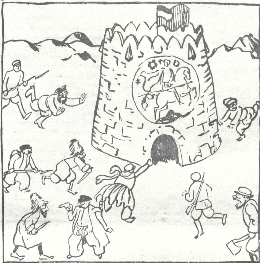
ძველათ ამოზღენ, ყველა გზა რომში მიდისო. ეხლა ეს ანდაზა უნდა შეიცვალოს, რადგან დღეს ყველა გზა საქართველოში მოდის.

კვერცხით ხელში, ვერ გაცოცხეთ რაგქნა ძმებო, რა არ ექენი, ფული, კვერცხის შესაძენი ვერ ვიშოვნე, ვერა, ვერა, მაპატიებთ, ვიცი, მჯერა, მე მილოცვას ასე გვიანს, (არ შეფერის ეს კაცს ქვიანს დარბაზობა, ახალკვირას) ქნარს ავიღებ, გავკრავე წკირას, ეხლა კვერცხიც შევიძინე: (დღე-და ღამე არ ვიძინე, ვედარბაზე ყველგან ქათმებს, ინდაურებს, იხვებს, ბატებს, ყველას ნისკარტზე ვაცოცე, თითო კვერცხი ავაცოცე), ეხლა მსურს ჩამოგირბინოთ, ზინიანებს და უბინოთ, გინახულებთ თითო-თითოდ, ამხანაგებს „საეზიტოდ“