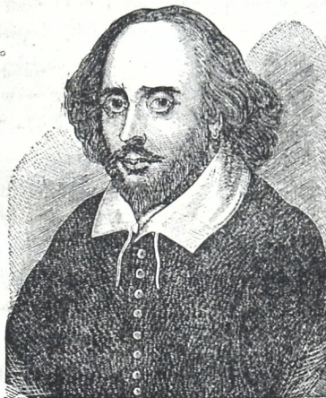
შექსპირი (დრამატული მწერალი).

ეს შერჩანი ქვეყანსა ხაზბი და უმადურთა: შირველათ იმას გასწირავს, ვინც გულთ-ნამსახურთა!