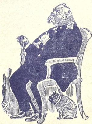
წარმოდგინეთ—ჩვენც თანაზინიას შევადგენთ...

— დას. საშწუნათა, რადგან მე ფულუბი მინდადჷს მკესხს მისგან.