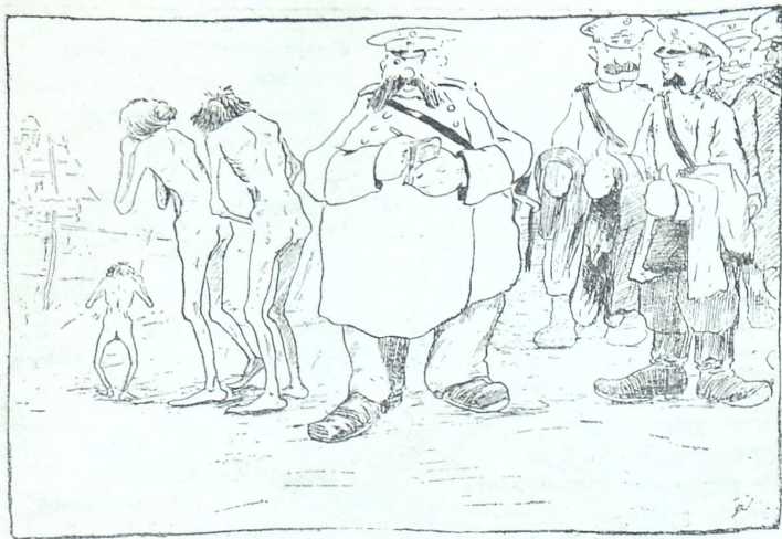
ნაბრძანებია: გადასახადები დაუყონებლივ გადაეხადებინოთ და ჩვენც ვხვლით...