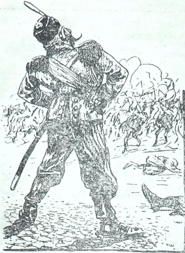
პირი: ერთი ასეთი გამარჯვებაც და დავიღუბე!