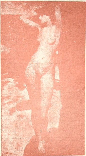
ზ. ტარხნილ ანდრომენდა.

ვეწერ ბაღებში. რას მიშველის შკოლა, რომ ვიკითხო, ვწერო? „კავალრების“ ყოლა, „ვოტ ჩუნდოე დელო“! მუშტიდღში „ლექტომა“ „პრელესტ“ გულაობა, ლამაზი ვარ მითომც ყველა თავს მევლდება. „მაზურკას“ თამაშში, უნდა მნახოთ ბალში, მორცხვად თავსა ვლუნავ. კაქკაქივით ვხტუნავ!.. თამაშობის დროსა, თითქოს ვფრინავ ცაში, არ მაკლია „ბრაფა“!.. „პოკლონიკთა“ ტაში. ვეცხოვრობ ნებიერად, არ ვემღერი ბედსა, * კისერ მოღერილი ვევარ მაშინ მტრედსა. მხოლოდ სამწუხაროთ, შველა არსით არი,— ვგებ თქვენ მხაროთ და მიშოგნოთ ქმარი. თუმცა პატარა ვარ,— მიყვარს ყმაწვილები, მხოლოდ გაბზევილი ქონდეთ უღვაშები!..