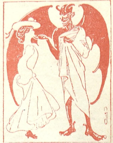
ეშმაკი. როგორ ბძანდება, ჩემო ძვირფასო. ქალი. თქვენ სცდებით მე სრულგებობას ვღაივარ ძვირად.