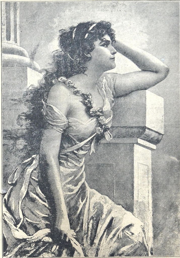
მლოდინუი. სურ. ედუარდ ბისსონისა.

სალამო არის, დაქრის ფერი, ხარობს ბუნება მინაზებელი, და მას მკრთალ სხევით ციდან დასცქერის თვით მოკმციმე ვარსკვლავთ კრებელი. უღარდფლობით გარე-მოცულნი ტკბილ ძილის პირულს ნაზათ მღერიან და ნელათ მავალ ღამისა გუშავს მოშობივმელათა ელიმებიან.