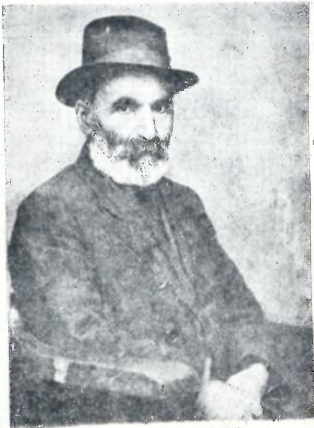
ზაკარია ჭიჭინაძე (1854—1933)

დღეს, ე. ი. გუშინ ოცდაათს წარსულ თვისას გაიხსნა საზოგადოება ლარიბ მოსწავლეთა შესაწევნელად, ბევრს გაეხარდა ამ საზოგადოების გახსნას, ვითომც და ბევრს ლარიბს უშველიანო. მაგრამ მე როგორღაც ეჭვში ვარ. ბე-