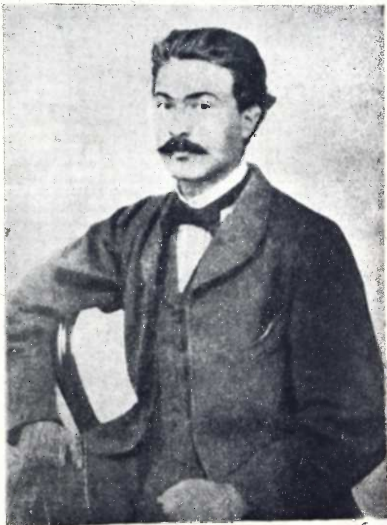
ანტონ ჰურცელაძე (1839—1913)