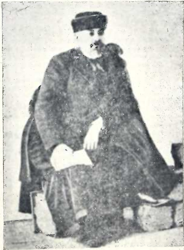
დავით კეხელი (1861—1907) გადასახლებული ციხიდან 1905 წ.

აი მაგალ. როგორ გავატარე ეს დღე. რვის ნახევარზე ავდექი. სანამ პირს დავიბანდი და ტანთ ჩაიცვამდი 10 შესრულდა. დილის ლოცვას და ჩაის მოუნდა ერთი საათი. ჩაის შემდეგ ნახევარ საათი ლაპარაკს მოუნდა, საათ-ნახევარიც ვიმეცადინე. ეგეც 11 საათი. დარეკეს შუა დღის ლოცვა, რომელმაც მოითხოვა 2 ნახევარი. (რადგანაც წყლის კურთხევა იყო). წირვის შემდეგ სა-