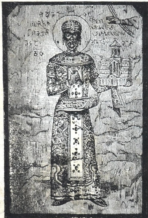
მეფე დავით აღმაშენებელი.