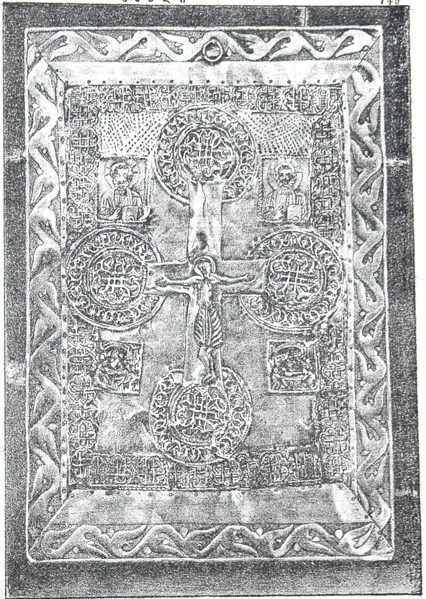
ჯ უ მ ა თ ი ს ტ ა ძ ა რ ი.