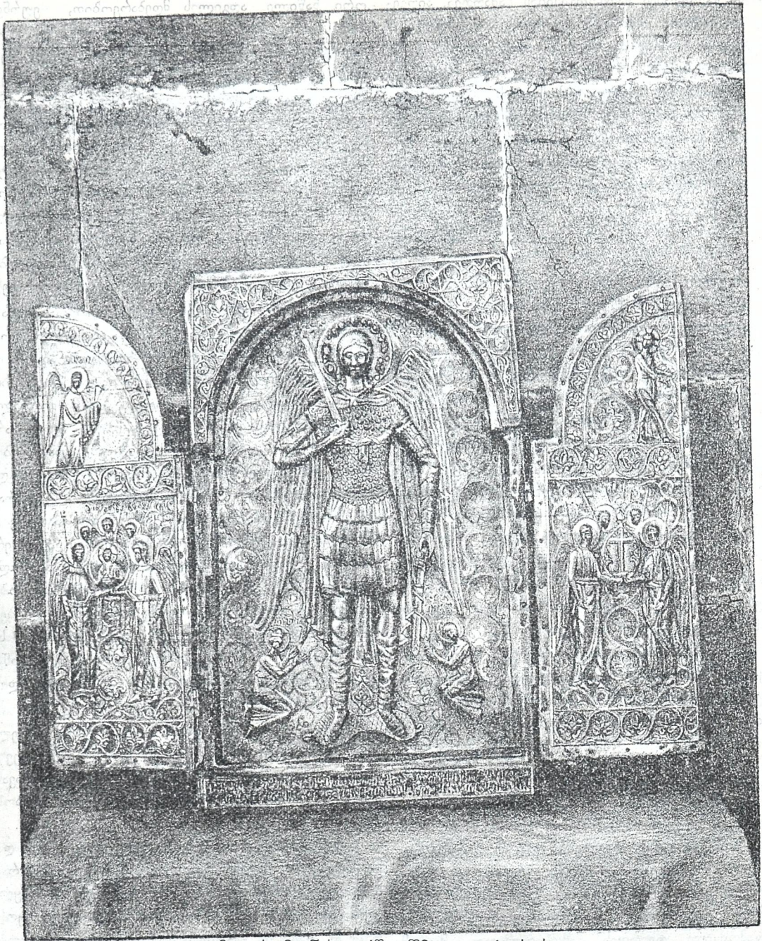
ჯუმბათის მონასტერში წმ. გიორგის ხატი.

დულზე ცხოვრებენ. ისინი მუშაობენ და მზა მზარეულს მომკილს და გაღეწილს ღალას აძლევენ მამულის პატრონებს. ზოგს მათკანს ნარდათ აქეს აღებული მიწა და მიუხედავთ იმისა, იქნება მოსავალი თუ არა, გადასახადი მაინც უნდა აძლიოს, ან სულადათ, ან ფულათ; ვისაც ასე ნარდათ არ აქეს გადაწყვეტილი, ისინი კიდევ უფრო უარეს დღეში