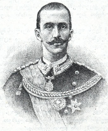
იტალიის ტახტის მეგვიდრე ვიქტორ ემანუილი.

წონებული და ნება დართულია კავკასიის ოლქის სამოსწავლო რჩევისაგან სკოლის ბიბლიოთეკებისათვის).