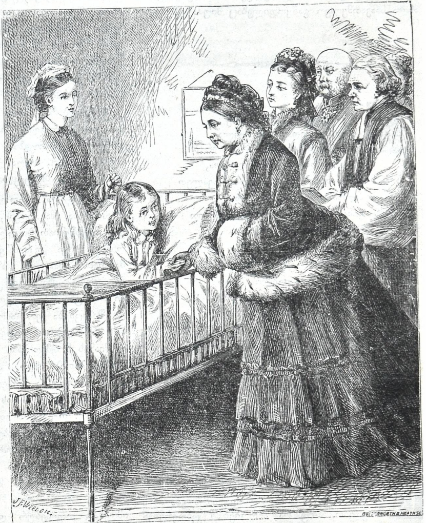
ინგლისის დედოფალი ვიქტორია ბავშვების საავათმყოფოს ათვარიელებს.

მოებაა, აუცილებელ საჭიროებათ მიაჩნიათ ბავშვებისთვის თავშესაფარის და საავათმყოფოს გამართვა. დედაკაცებო კაცებივით გადიან სამუშაოთ ზ ბავშვებს შენახვა უნდათ. არც სახეიროა, როდესაც ავათმყოფ ბავშვებს დაწვენენ დიდებთან ერთათ სამკურნალოში. ამიტომაც ყველა კარგა მოწყობილ ევროპიულ ქალაქებში უსათუოთ არის ხოლმე ბავშვებისთვის თავშესაფარი და საავათმყოფო და ამის ხარჯი მთლათ აწეება ან ქალაქს, ან ქველმოქმედ პირებს. ჩვენ მოგვყავს ორი სურათი ქალაქ ლონდონის საავათმყოფოსი. ერთზე ნაჩვენებია სუფთათ მოწყობილი ოთახი, ავათმყოფ ბავშვებით საცე თავიანთ