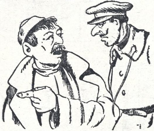
გლზნი. (მალიციელს)—ჩქარა, ჩქარა! მეშვიდე ვერღზე კომპერატებს სძარცვავენ!