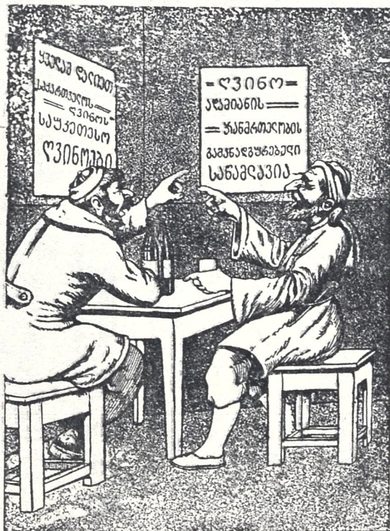
პირველი ზღვანი (მეორეს) — ეს ხალხი მართლა გადარეულია, ერთს პლაკატზე სწერენ, ღვინო საწამლავიაო და მეორეზე კი ღვინის ხმას