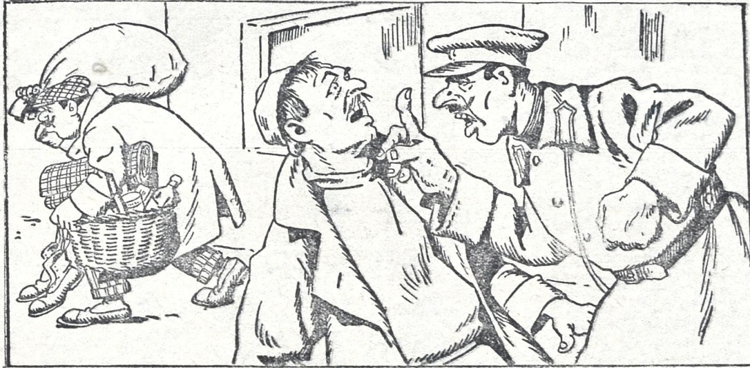
მილიციელი. (გლებს)—შენ გფი ხომ არა ხარ! ეგ კოლპერატივის ნოქარია, მუშაობა დასრულებული სახლისკენ მიდის!