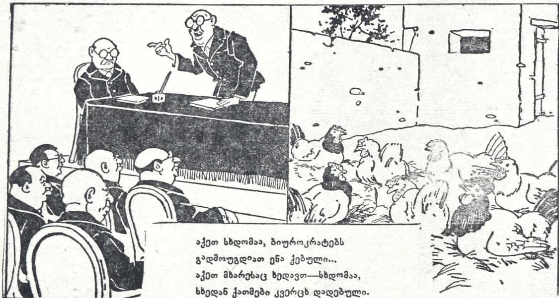
აქეთ სხდომა, ბიუროკრატებს გადმოუგდოთ ენა ქებული... აქეთ მხარეხაც ხედავთ—სხდომა, სხედან ქათმები კვერცხ დადებული.