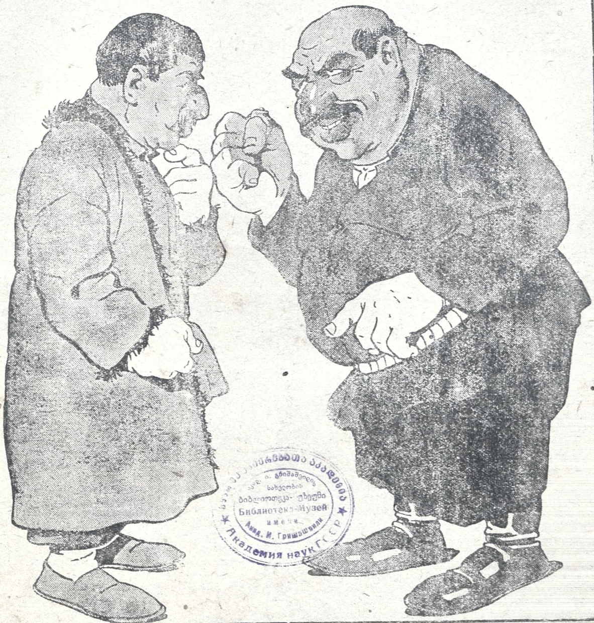
კულაკი. წელს როგორც ეტუობა, მე ვეღარ მოვახერხებ საბჭოში გაძვრომას, უნს რჩევას კი როგორმე მოვახერხებო. აბა შენ იცი, როგორც ეცდები ჩემი ინტერესების დაცვას, თუ არა და დღესვე ამოუკვე ჩემივალდი.