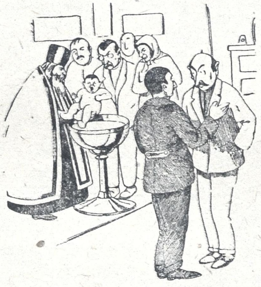
— რატომ ეკლესიაში არ ნათლავთ ბ. უნს? — როგორ შეიძლება, მამა მარტიულია — ღმერთი ა სწამს!

თიანეთის რაიონში ხშირი შემთხვევაა— მარტო და კომპლექსორის წვერების ეკლ- სიებში და ნათლობა-ქელსებში სიარული. გლეხების წერილიდან