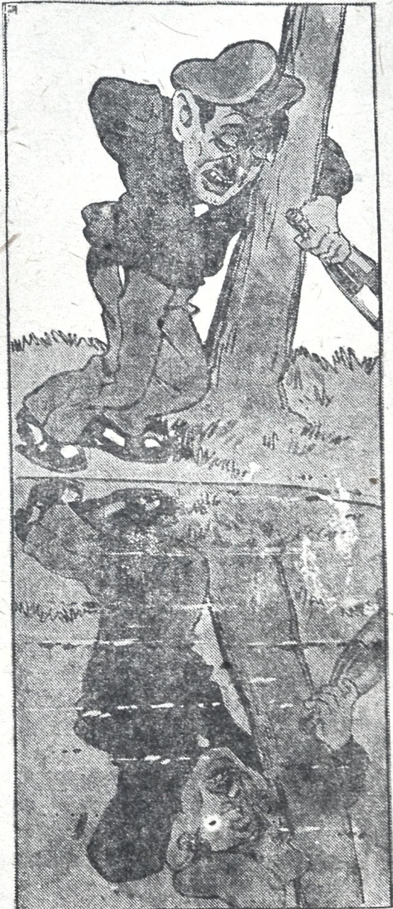
სახეობ თავმჯდომარე — შეხეთ ამ ლაწირაკ გლუბკორებს ისეც გამოუქიმივარ კელის გახეთში?!