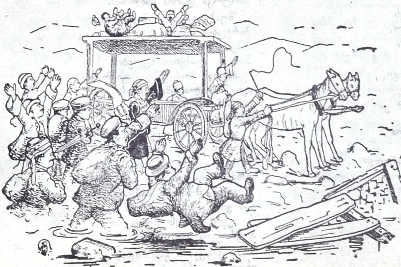
ღაბა-სოფლებში მოგზაურობა დიდაუნებით.

იესო ქრისტემ ერთხელა ხალხის გამოცდა ინება: ვინ ცხოვრობს მუდამ წვალებით და ან ვის მოეღბინება.