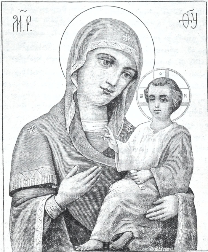
სახე იმ ღვთისმშობლის ხატისა, რომელიც სპარსელებმა წაიღეს მცხეთიდან.

ხატის სახე დათვალიერა, ნახა, რომ ეს სასწაულთ- მომქმედი საჭაბოკო ხატი ძველი დროის მხატვრობა იყო. დახატულია თითბრის გარეშით სქელს მუხის ფიფრზე, შუაზე ამოჭრილია, ნაზიკობი გამოწველი აქვს; ქვემო ბოლოს შუაზე წინა ბიძგე ამომტრეულია ის ნაწილი, რომელზედაც გამოხატულია ფეხი ძემღეთისა. ზემოთ წაწერილებულია, თვითონ ფიფრი გასე- თქილია თავადვე ურწმუნო სხაბსელებსაგან, რომელთაც