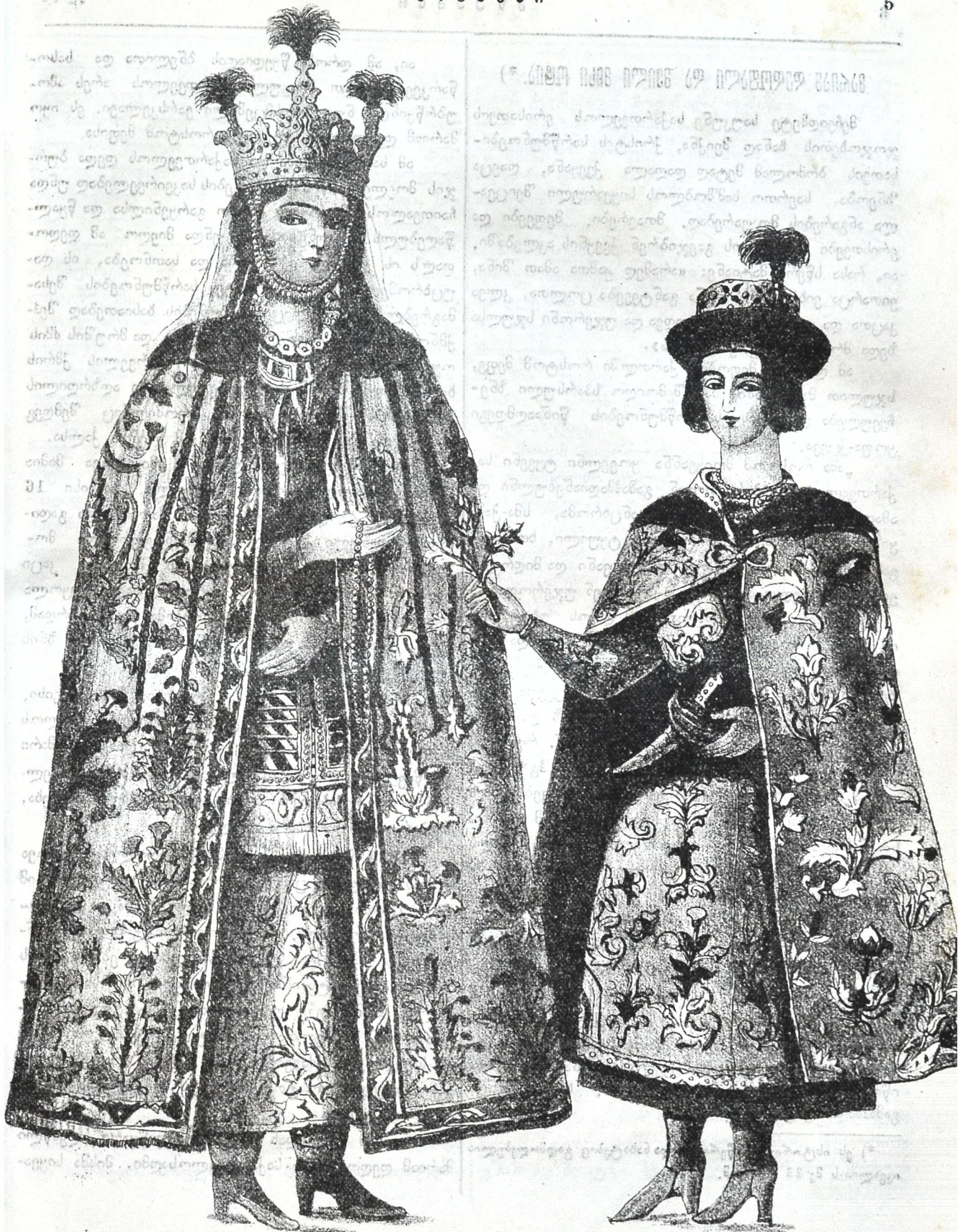
მარია და დედოფალი და შვილი მისი ოტაბ.