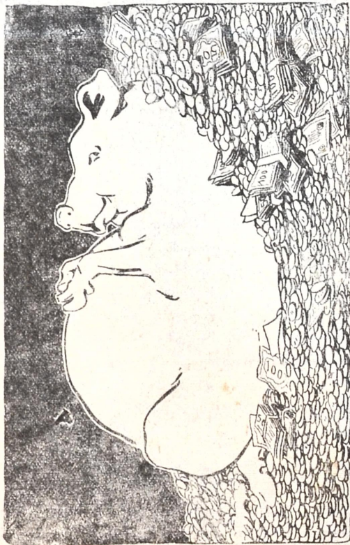
ბატონი ღორი უზრუნველათ ცხოვრობს

იძახის: „ხეობი ვისწავლე, ადვილი, „ახალ-მოდისო“! წამოდით, გზები აკეთეთ— მაზრის უფროსი მოდისო“.