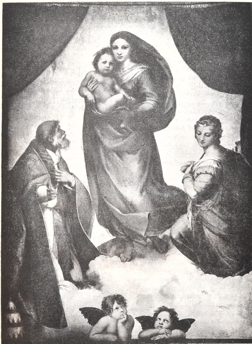
ახლად მოვლენილი. — მურაღაია) ნასატი.

რას შემომცქერი?! რაო, მიცანი? მიცან, შენი დღიური მონა, ხელ წართმეული შენს ქარხანაში?..