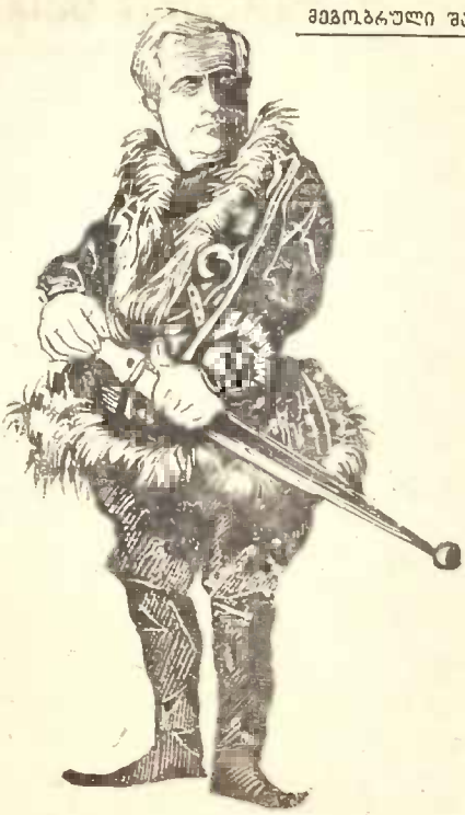
ცნობილი ოპერის მხახიობი. მისი მე-13 იუბილეს გამო.