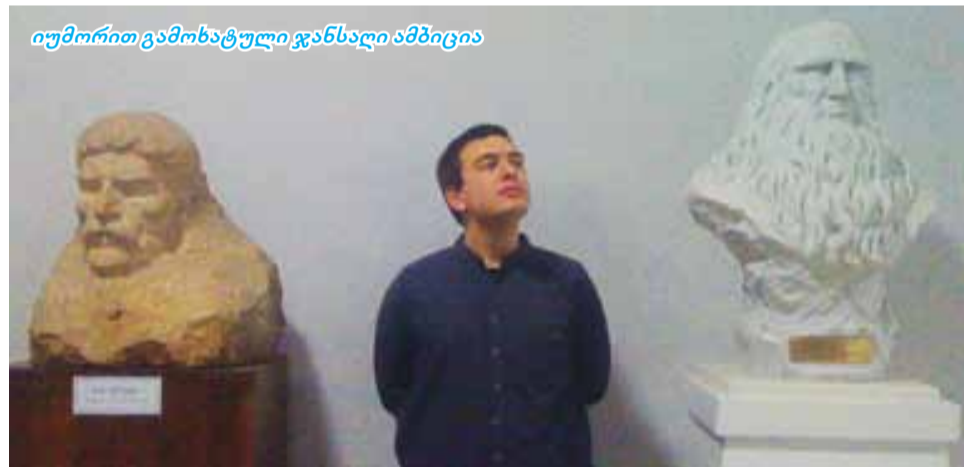
იუმორით გამოხატული ჯანსაღი ამბიცი

„ამ რევოლუციამ გარდაქმნა მთელი მაშინდელი ევროპული საზოგადოება. ერთი ადამიანის, მეფის ხელში მოქცეული მმართველობის ნაცვლად დემოკრატიული პროცესები, მოქალაქეების სოციალურ და პოლიტიკურ პროცესებში ჩართვა დაიწყო. ეს თემა კარგად X კლასში შევისწავლე და მაშინ გადავწყვიტე, რომ პოლიტიკური მეცნიერებები, უფრო კონკრეტულად კი პოლიტიკური სოციოლოგია ჩემი შესწავლის საგანი გამხდარიყო. ასე მოვედი უნივერსიტეტში და პირველი კურსიდან დღემდე არასდროს თავი არ შემიკავებია და ჩემს მოსაზრებას სხვადასხვა აქტუალური პრობლემების შესახებ თამამად გამოვხატავდი. გარკვეული პერიოდის განმავლობაში, ობიექტური მიზეზების გამო, სტუდენტებს არ ჰქონდათ საშუალება, რომ უნივერსიტეტის გაზეთში სტატიები გამოეყვეყნებინათ, სტაჟირება გაეწეოთ, თუმცა ახლა „სტუდ-უსიკის“ საშუალებით მათ ფართო ასპარეზი მიეცათ, რომ საკუთარი პოზიციები გამოხატონ და კრიტიკული აზროვნება განვითარონ. ამ ჩანართის საშუალებით შეძელი, რომ შიდა საუნივერსიტეტო პრობლემებზე, მათ შორის, სამეცნიერო კვლევების დეფიციტზე მესაუბრა სხვებთან ინტერვიუებსა თუ საკუთარ სვეტებში. ასევე, მოვახერხე მსჯელობა ისეთ მნიშვნელოვან საკითხებზე, როგორც არის უმუშევრობა, სოციალურად დაუცველობა; დავწერე სტატიები ეკოლოგიური უსაფრთხოების თემებზეც; შევეცადე, რომ დღის წესრიგში დამეყენებინა ჩემთვის და ჩემი მეგობრებისთვის აქტუალური საკითხები. ვფიქრობ, ეს განსაკუთრებით მნიშვნელოვანია იმ ფონზე, როდესაც მასობრივი მედია საშუალ-